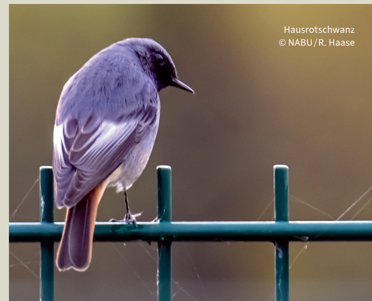
Hausrotschwanz