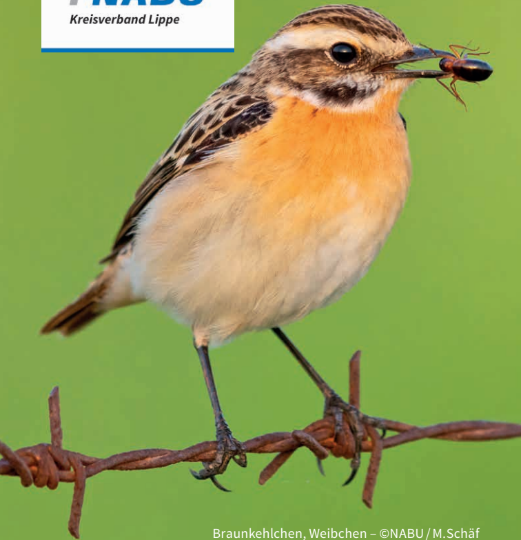
Braunkehlchen, Weibchen